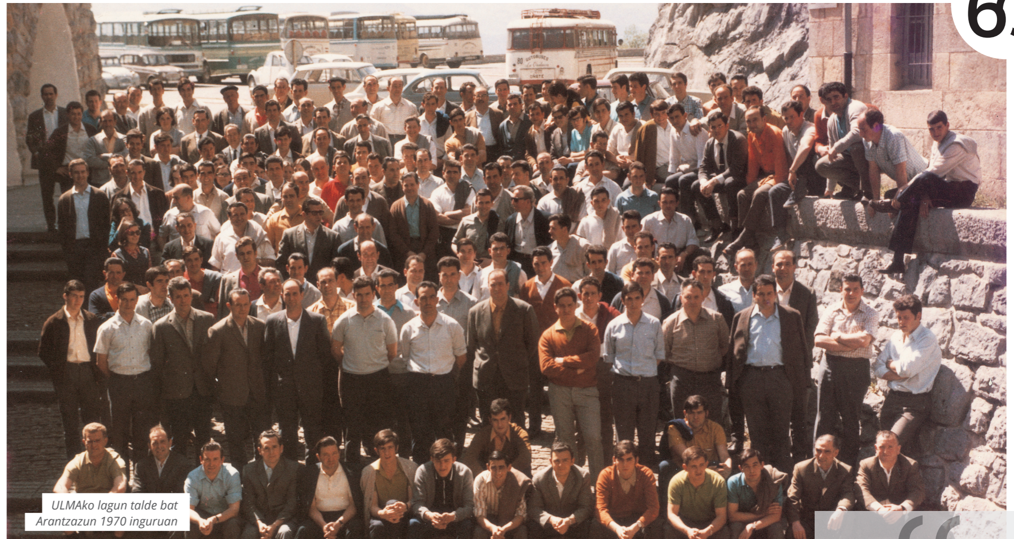
ULMAko lagun talde bat Arantzazun 1970 inguruan

2021. urtea urte berezia izango da denontzat. Jaio ginenetik 6 hamarkada joan dira, eta horietan bada zer azpimarratu: gure pertsona guztien ahaleginaren bidez proiektu komun eta solidario bat osatzeko konpromisoa eta ilusioa . Osasun krisi globalaren ondorioz gizarte gisa zailtasunak izaten ari garen arren, 2021. urtea berezia izango da, nondik gatozen gogoratu eta nora goazen ulertzen lagunduko digun urtea.