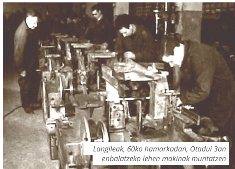
Langileak, 60ko hamarkadan, Otadui 3an enbalatzeko lehen makinak muntatzen