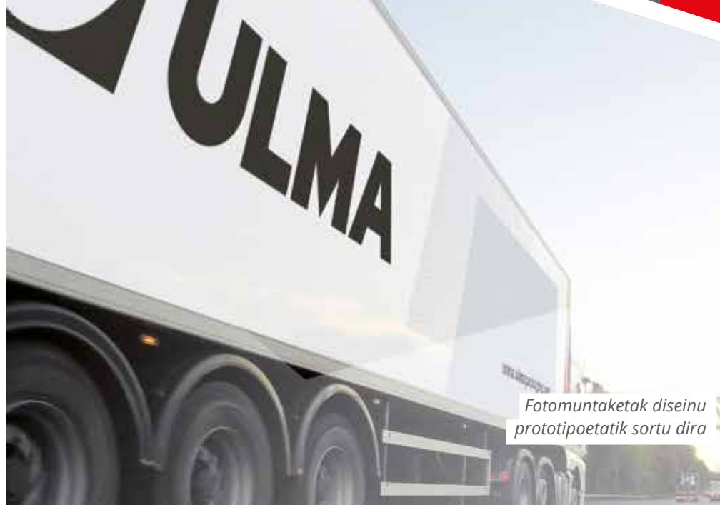
Fotomuntaketak diseinu prototipoetatik sortu dira