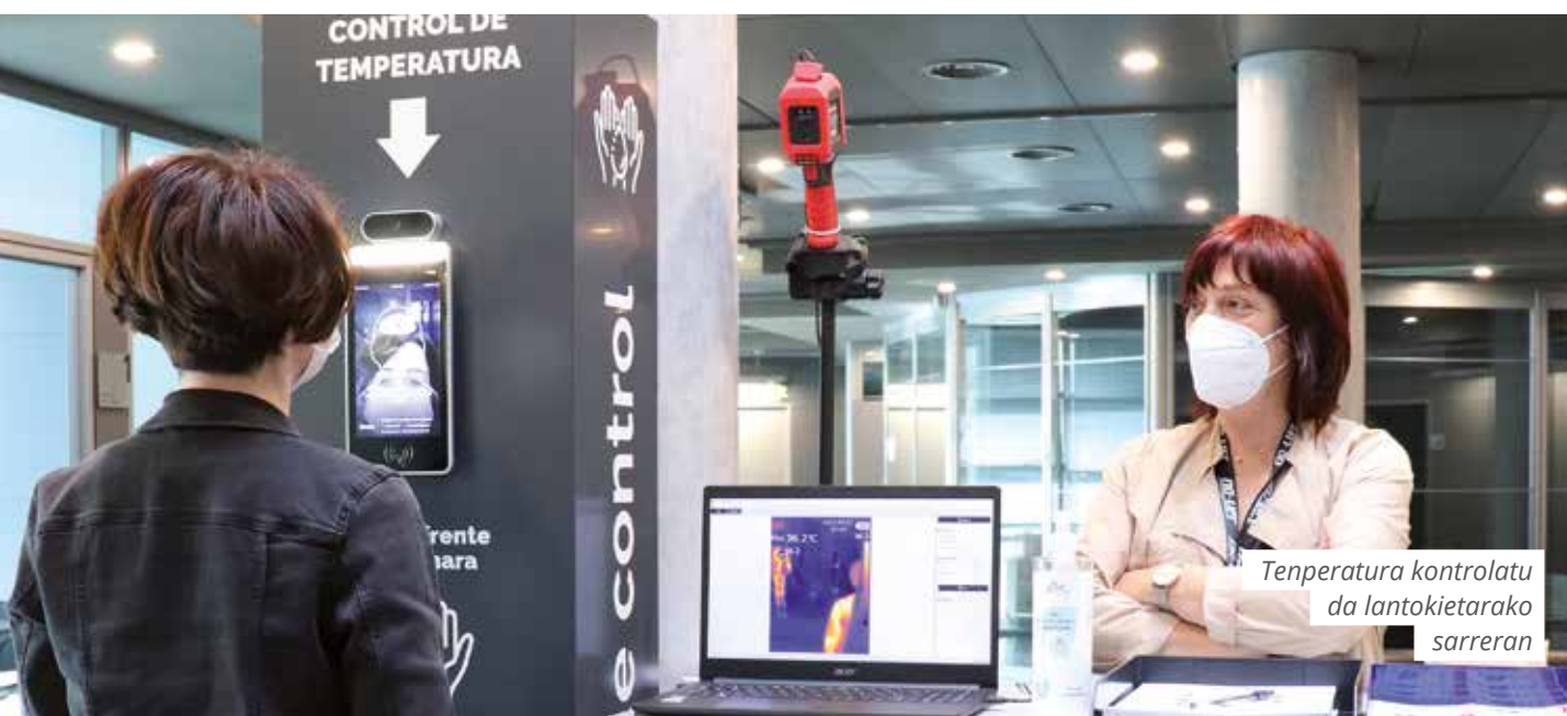
Tenperatura kontrolatu da lantokietarako sarreran