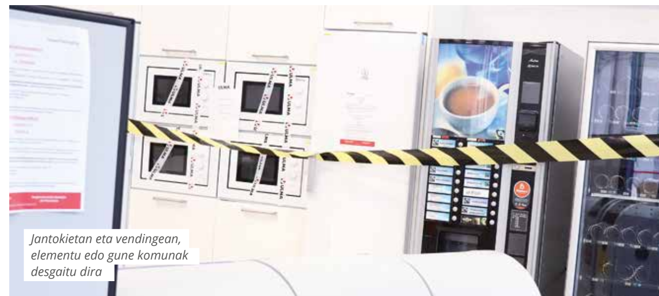
Jantokietan eta vendingean, elementu edo gune komunak desgaitu dira