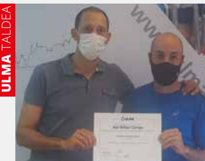
ULMA Conveyor Componentsen diplomak banatu dira