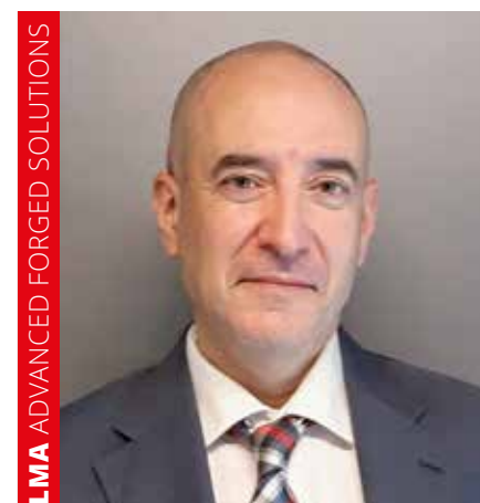
ULMA ADVANCED FORGED SOLUTIONS