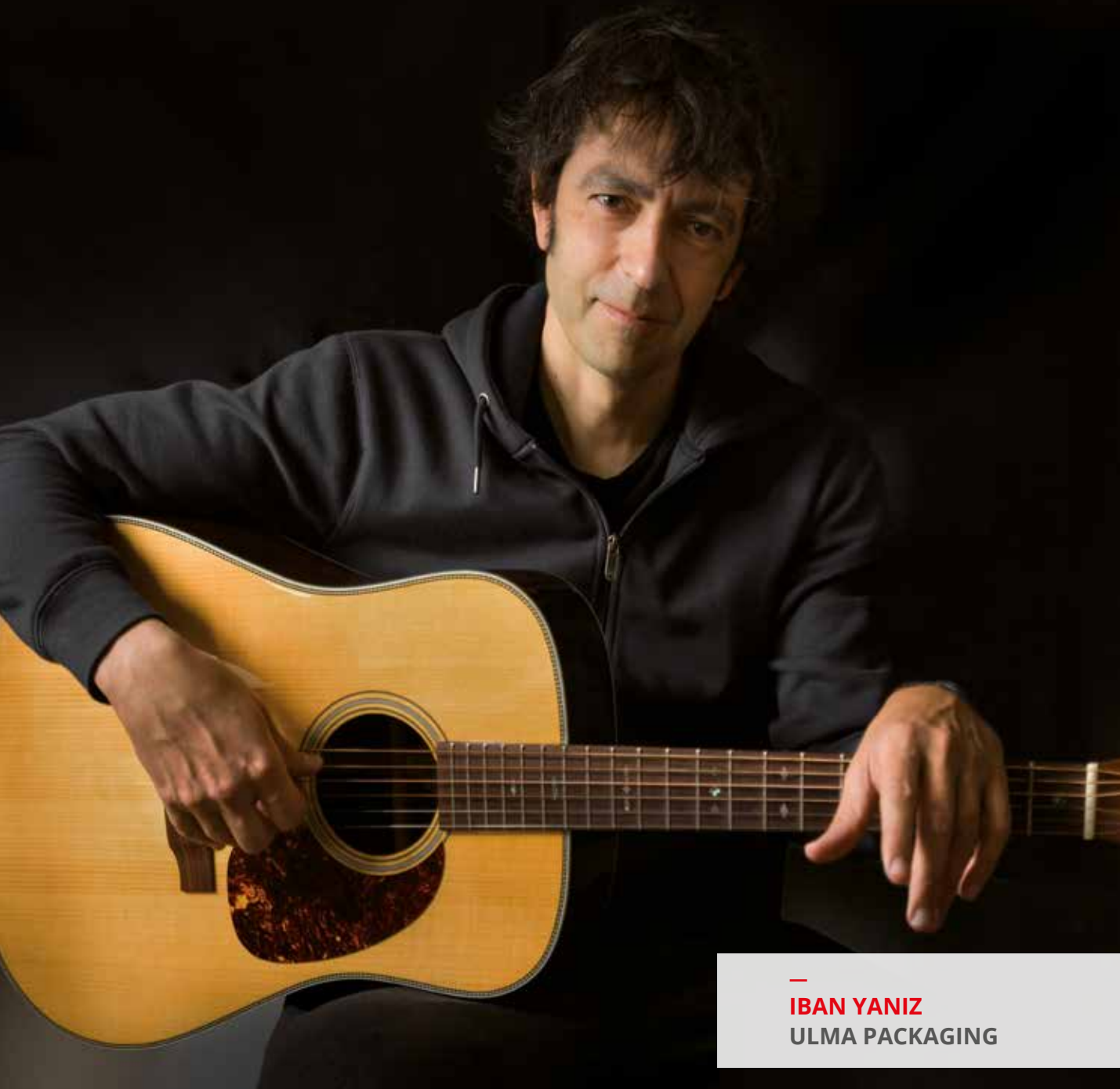
— IBAN YANIZ ULMA PACKAGING

“ASKO-ASKO GOZATU DUT DISKOA SORTZEKO PROZESU OSOAN. MUSIKAK, ETA ARE GEHIAGO INSTRUMENTU BAT JOTZEAK, AHALMEN TERAPEUTIKO HANDIA DU ETA OSO IHESBIDE ONA DA”.