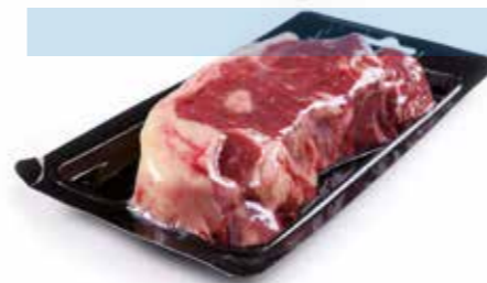
Reduced Scrap edo Ebakin murriztua

“Easy open” ertz bat dauka, tapako filma kentzeko, eta bigarren ertz bat, erretiluak dituen bi materialak bereizteko. Hartara, gerora, errazago birzikla daiteke.