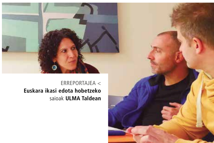
ERREPORTAJEA < Euskara ikasi edota hobetzeko saioak ULMA Taldean