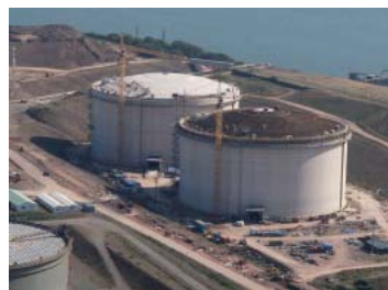
LNG/GNL biltegitratzeko tankeak egiten, Dragonen proiekturako