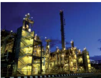
Etileno planta, eraikitzen ari direnaren antzekoa

eraikitzen den horrelako lehenengo planta. Azken kontratu hori ULMAk ingeniartzita berari dagoeneko egindako beste proiektu bati gehitzen zaio: hura Singapurreko planta baterako izan zen, eta jabea EXXON MOBIL Chemicals da. Azkenik, WHESSOE OIL & GAS ingeles ingeniartzarekin lehenengo kontratua lortu izanak duen garrantzia azpimarratu behar da. Kontratua DRAGON LNG proiekturako da, eta LNG / GNL (gas natural likidotua) gasifikatzeko planta bat da. Gasa Aljeria, Trinidad, Oman eta Qatar bezalako herrialde ekoizleetatik iristen da, gas ontzi handietan, eta Erresuma Batuko Gales eskualdearen (Mildford Heaven) behar energetikoak asetzen ditu. Erresuma Batuan sortzen den energiaren %40 gas natural bidez ekoizten da eta, Ipar Itsasoko gas erreserbak murriztu eta energi eskaera handitu egin dela eta, datozen urteetan bertan birgasifikatzeko planta berriak egitea proiektatu da. "Nabarmentzekoa da jada entregatu diren proiektuetan ULMAk egin duen jarduera integrala, horri esker bezero berriak atzitzea eta dagoeneko daudenak atxikitzea lortzen ari baita, horiek direlarik hain zuzen ere negozioaren garapenaren giltzarria" .