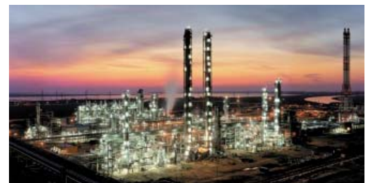
PTA planta, eraikitzen ari direnaren antzekoa