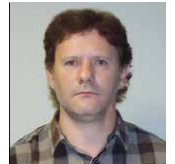
JUAN CARLOS AZKARGORTA