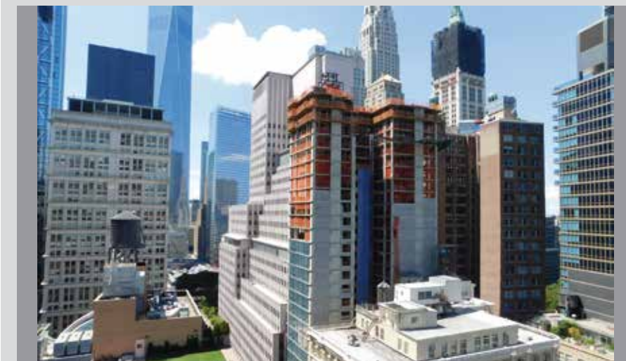
ULMA Embedded Solutionsentzat proiektuaren irudi bat.

ULMA soluzio integralak bezeroaren premiak ase ditu, hornei eta lauzei dagokienez. ALUPROP Aluminiozko eskorek lau lan mailari eta CC-4 enkofratuari eutsi ahal izan diete Enkofratu modular arineko panelak zutabeei, hornei, habe txertatuei, igogailu zuloei eta zapatei forma emateko erabili dira.