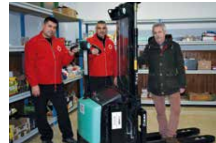
ALBISTEAK > ETA GAURKOTASUNA ULMA Orga Jasotzaileak Gurutze Gorriarekin