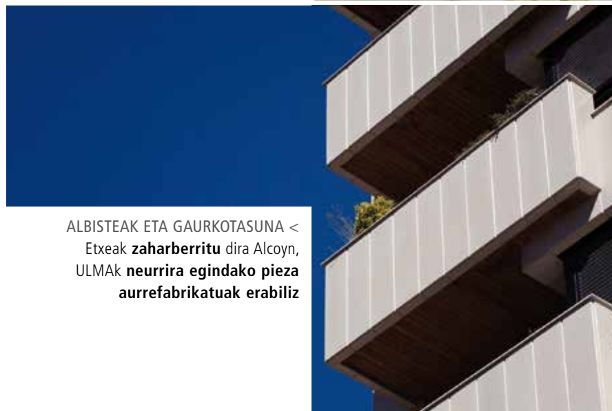
ALBISTEAK ETA GAURKOTASUNA < Etxeak zaharberritu dira Alcoyn, ULMAk neurrira egindako pieza aurrefabrikatuak erabiliz