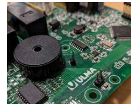
ULMA Embedded Solutionsentzat proiektuaren irudi bat.

ibilbidea hasten duelako, eta, bestetik, nekazaritza eta abeltzaintzarako “smart” teknologia eta aplikazioen garapenean sartuko delako lehen aldiz.