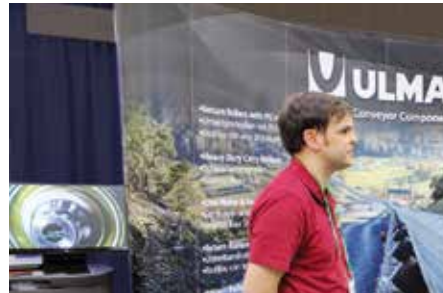
ALBISTEAK ETA GAURKOTASUNA < ULMA Conveyor Componentsek arrabol motorizatu berriak aurkeztu ditu AEBetan