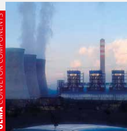
ULMA CONVEYOR COMPONENTS

Arrabolak berariaz diseinatu dira karga baldintza handiak (18.000 tona orduko), bandako abiadura (5.2 m/s) eta eremu horretako euri, bero eta hezetasun baldintza gogorak jasateko.