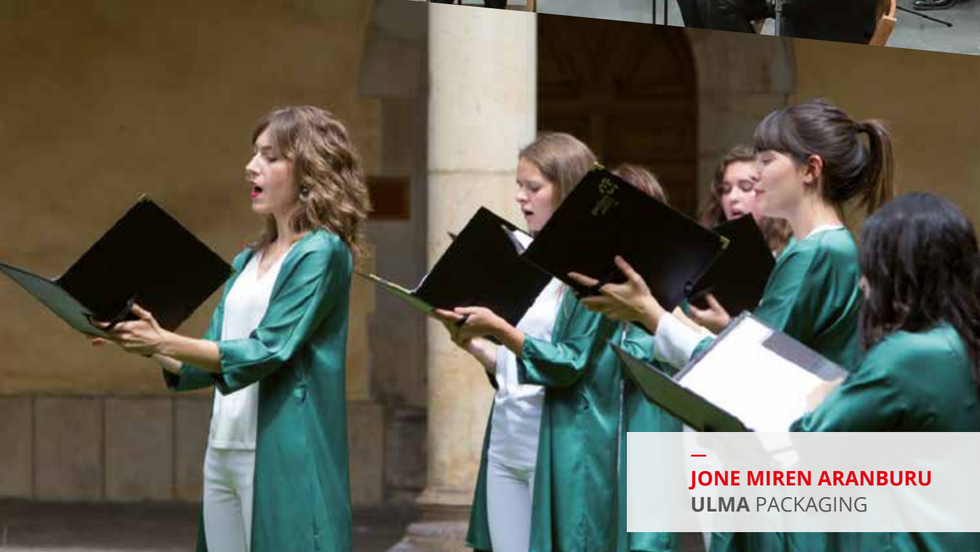
— JONE MIREN ARANBURU ULMA PACKAGING