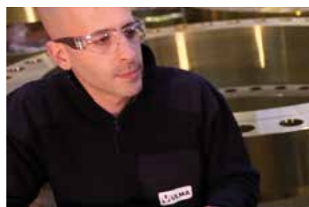
ERREPORTAJEA. Kualifikazio profesionala: erronka, aukera.