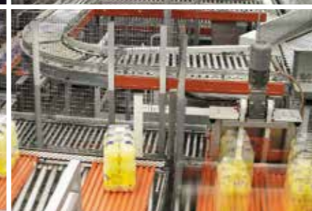
ERREPORTAJEA. ULMA Handling Systemsek Eroskirentzat garatutako plataforma logistikoa automatizatu du; aitzindari da European.