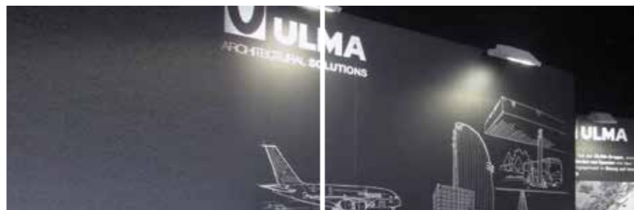
ALBISTEAK ETA GAURKOTASUNA. ULMA Architectural Solutions, Drainatzeko soluzioak Municheko BAU Azokan.