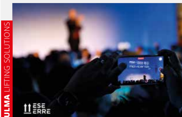
ULMA LIFTING SOLUTIONS

Movicarga Sariak funtsezko topaketa bat da industriako lider eta profesionalentzat, bikaintasuna aitortu, perspektibak trukatu eta lorpenak ospatzeko gunea. Oraingo edizioak, tradizioa eta modernitatea uztartu dituelarik, sarietako industriaren panoraman duten garrantzia berretsi du.