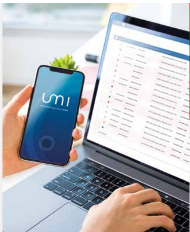
ULMA MEDICAL TECHNOLOGIES

Horrenbestez, zerbitzuaren erregistroetarako sarbidea azkarragoa eta osoagoa izango da, eta, ondorioz, akats medikoen arriskua eta itxaronaldiak minimizatuko dira. Arreta mediko eraginkorragoa eskainiz eta emandako osasun arretaren kalitatea handituz.