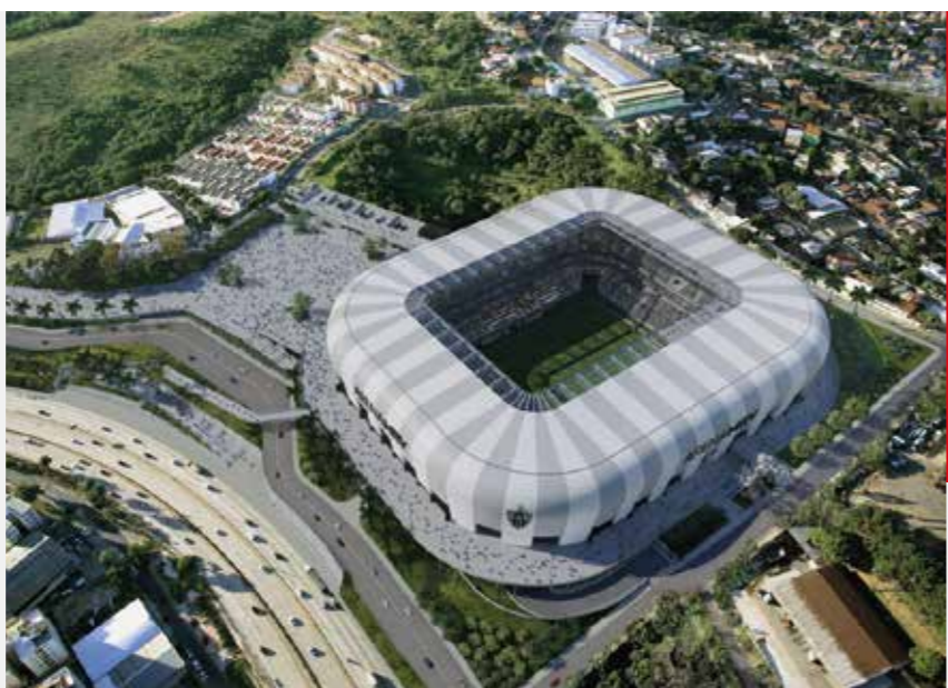
ULMA ARCHITECTURAL SOLUTIONS

Hasieran, tokian bertan fabrikatutako kanalak erabiltzea aurreikusita zegoen. Baina azterketa hidrauliko bat egin ondoren, ULMAko ingeniariak taldeak ebazti zuen aukerarik onena zela goitik beherako malda itxurako kanalen banaketa.