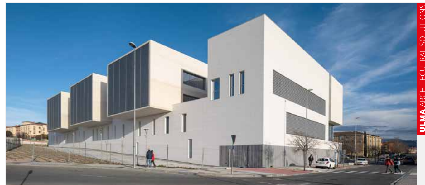
ULMA ARCHITECTURAL SOLUTIONS

Segoviako Epaitegi berrien zuzendaritza fakultatiboak estetika garaikide bat gehitu du, lerro garbiak eta bolumenekin eta geometriarekin jokatzen duen diseinua dituen , giro profesional eta serio bat sortzeko.