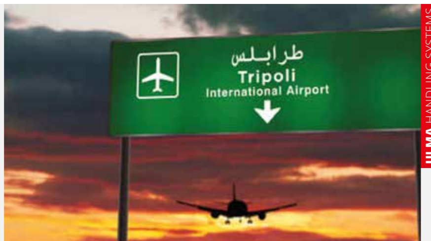
ULMA HANDLING SYSTEMS

Baggage Handling Systemek (BHS), oro har (Etxeko zatia+