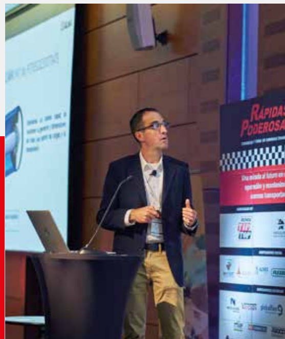
ULMA CONVEYOR COMPONENTS

Helburua da erreferentziako Beltfriendly hornitzaileetako bat izatea.