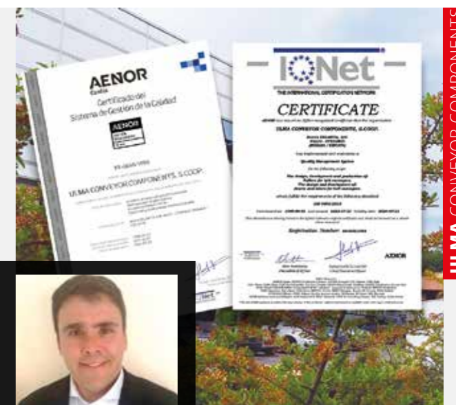
ULMA CONVEYOR COMPONENTS

ULMA CONVEYOR COMPONENTS - Kalitateko arduraduna "Azken 25 urte hauek etengabeko ikaskuntza ekarri dute, aurrera egiten jarraitzeko eta gure nortasun ezaugarria izatea nahi dugun negozio ereduaren balioa nabarmentzeko".