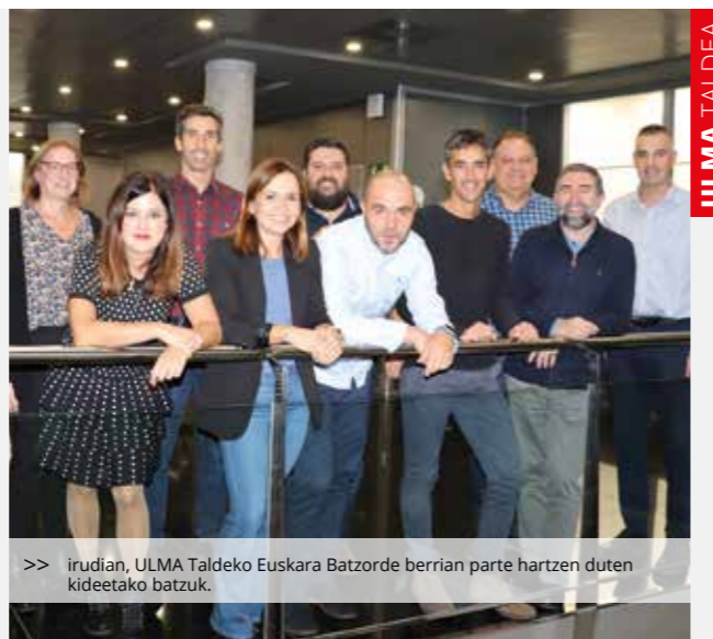
>> irudian, ULMA Taldeko Euskara Batzorde berrian parte hartzen duten kideetako batzuk.

Orain arte ULMA Taldeko Euskara Batzordean ibilitako kide guztiei egindako lanarengatik esker ona adierazi zaie.