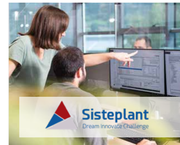
ULMA EMBEDDED SOLUTIONS

Sisteplant aholkularitza eta ingeniariatza industrialeko enpresa bat da, eta bere jardueraren nagusia enpresen emaitzak hobetzea da, ekoizpen, logistika eta antolaketa prozesuen analisiaren eta optimizazioaren bidez. Horretarako, MES CAPTOR® du, fabrikazio prozesuak antolatu, kontrolatu eta monitorizatzeko softwarea, eta GMS/GMAO PRISMA®, ekipoak eta instalazioak mantentzeko sistema.