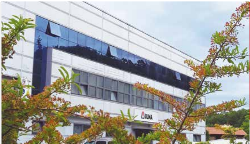
ULMA CONVEYOR COMPONENTS

Langile haiek altzairuari lotutako Otxandioko iragana berreskuratu zuten, nekazaritzako eta arrantzako