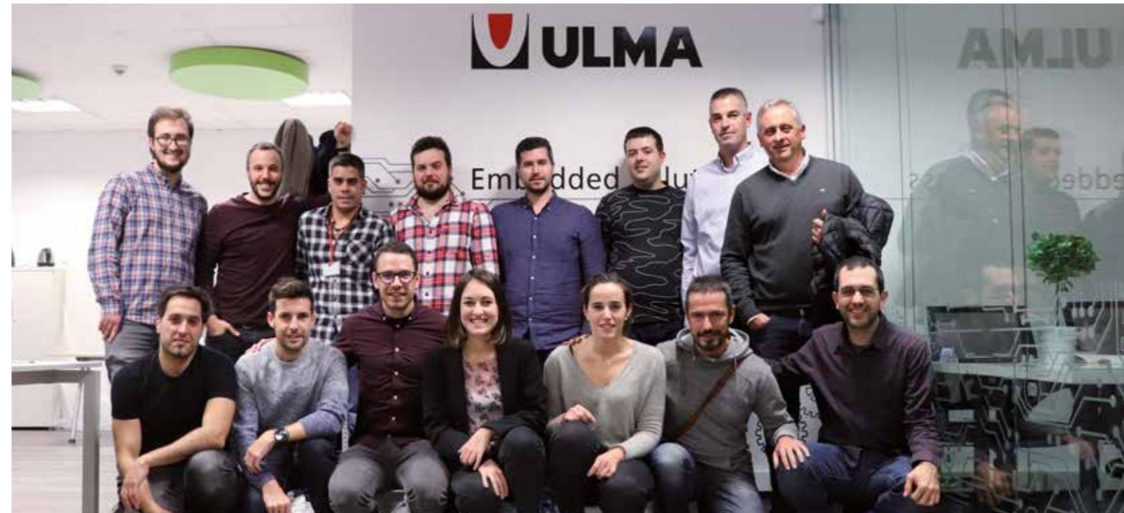
ULMA Embedded Solutionseko taldearen zati bat Bilboko bulegoaren inaugurazioan >>