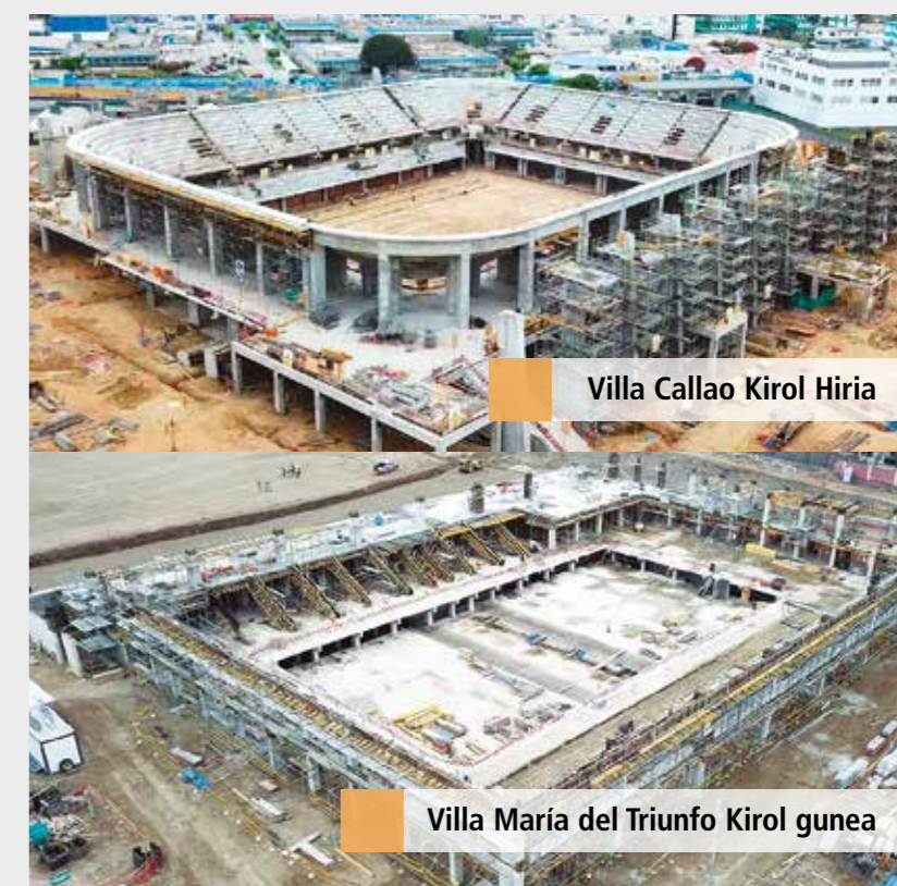
Villa Callao Kirol Hiria

Villa Maria del Triunfo kirol gunearen eraikuntza proiektuan, berriz, egituren aldaera zabala dela eta, fast-track metodologiaren bidez lan egin zen, bere ezaugarria izanik obraren exekuzioa eta planifikazioa aldi berean egin zirela; ondorioz, astero planoak aldatu behar izan ziren. Bezeroarekin etengabea komunikazioari esker, eta jokaleku berri bakoitzaren eskakizunak aintzat hartuz, ULMAk enkofratu eta aldazio soluziorik egokienak planteatu zituen bere ingeniari-taldeen bidez, zeina, egoera konplexuak konpontzeko soluzio bateratua eskaintzeaz gain, obra muntatzeko prestakuntza emateaz ere arduratu zen.