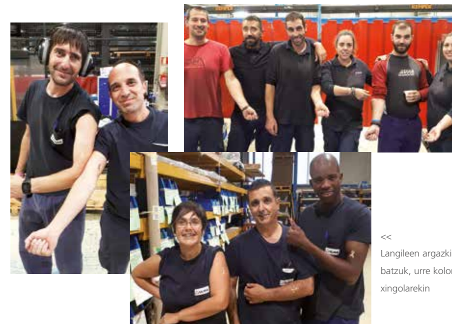
<< Langileen argazki batzuk, urre koloreko xingolarekin

Pasa den irailean zehar haurren minbiziaren sentsibilizatzeko nazioarteko hilabetea garatu zen. 1978az geroztik, urre koloreko xingola eta argia dira mundu guztian minbiziaren paziente gazteenak ordezkatzeko dituen sinboloak, gaixotasun horren aurka borrokatzeko ausardiaren balioa agerian jartzeko. Legazpiko ULMA Packagingeko lankideek ekimen horrekin bat egin zuten, urre koloreko xingolaren irudia zuen kalkomania bat jarrita . Argazkiak egin eta ASPANOGLren (Gipuzkoako Haur Onkologikoen Gurasoen Elkarte) sare sozialetan argitaratu ziren.