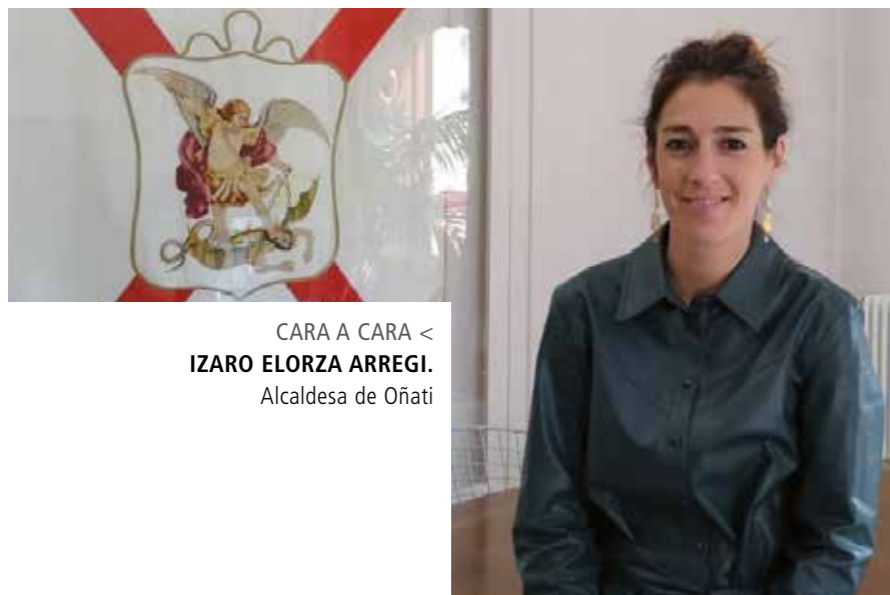
CARA A CARA < IZARO ELORZA ARREGI. Alcaldesa de Oñati