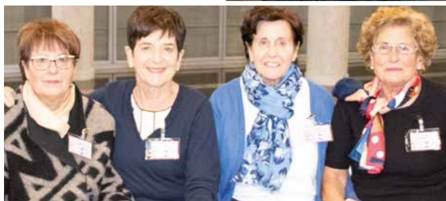
REPORTAJE < Mujeres de ULMA en la década de los 60

NOTICIAS Y ACTUALIDAD < Nueva solución de albardilla con curvatura especial para una rehabilitación residencial en Zaragoza